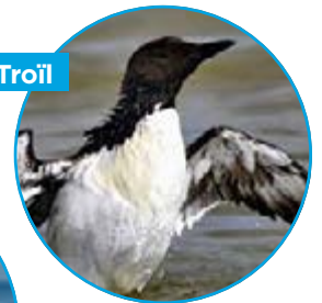
Guillemot de Troïl