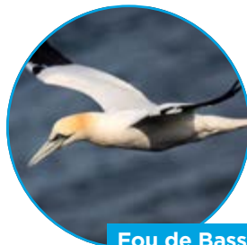
Fou de Bassan